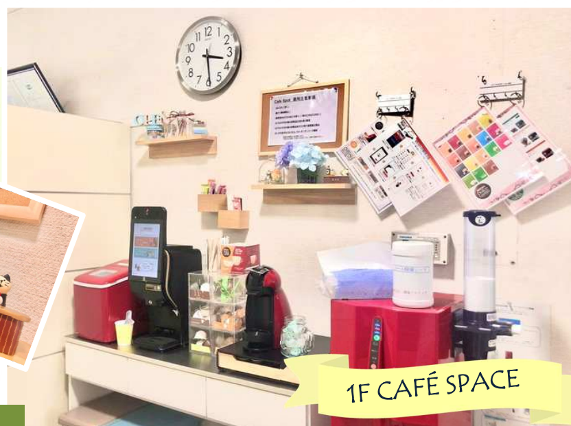
1F CAFÉ SPACE

仕事に行き詰まった際の気分転換、ちょっとした休憩の際に気軽に利用できる場所になるよう、今後もよりよい空間づくりを目指していきたくと思います。